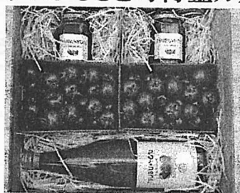
(選定例) ミニトマトギフトセット

事業所の負担金につきましては、被表彰者の記念品代に当てさせていただきます。 東浦町のふるさと寄付金カタログの中から地元の特産品を選定させていただきます。