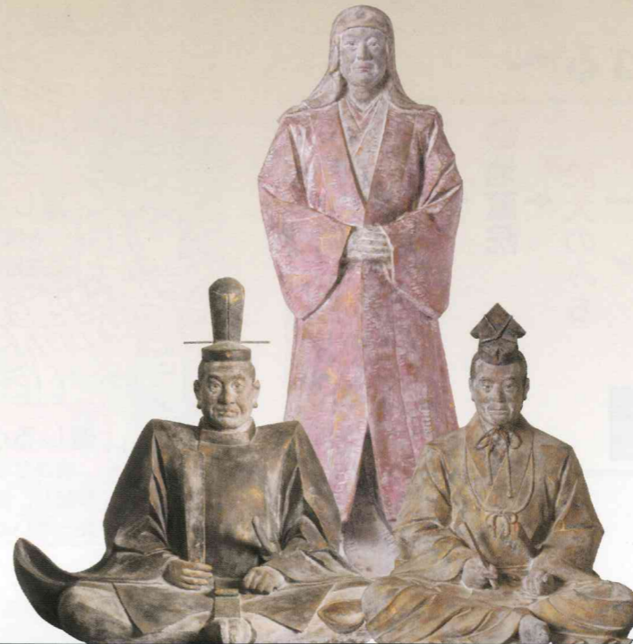
徳川家康(左)・於大(中)・水野忠政(右) 木彫 栗山賀行 作 東浦町郷土資料館 所蔵