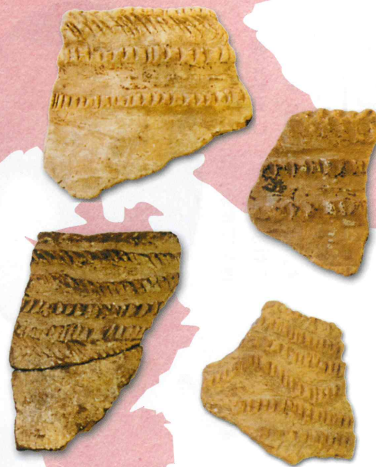
入海貝塚出土土器