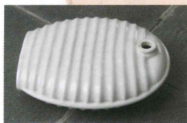
▲湯タンポ (ゆたんぽ)