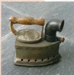
▲炭火アイロン (すみびあいろん)