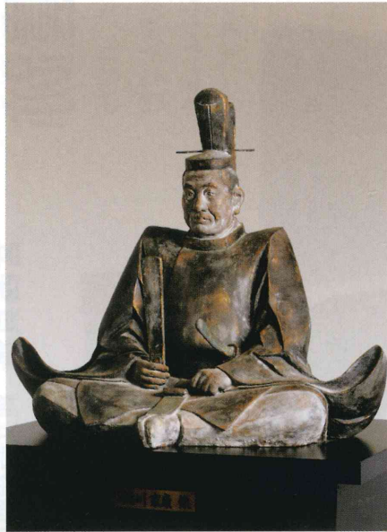
とくがわ いえやす 徳川家康 (1542-1616)

母は水野氏の娘於大の方、岡崎城主松平広忠の嫡男として生まれる。幼名竹千代。今川義元の人質として駿府で成長する。於大の母源応尼に養育され、今川の軍師太源雪斎を師とした。関ヶ原の戦いに勝利し、1603年征夷大将軍に任ぜられて江戸幕府を開く。