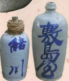
▲通い徳利 (かよいどくり)