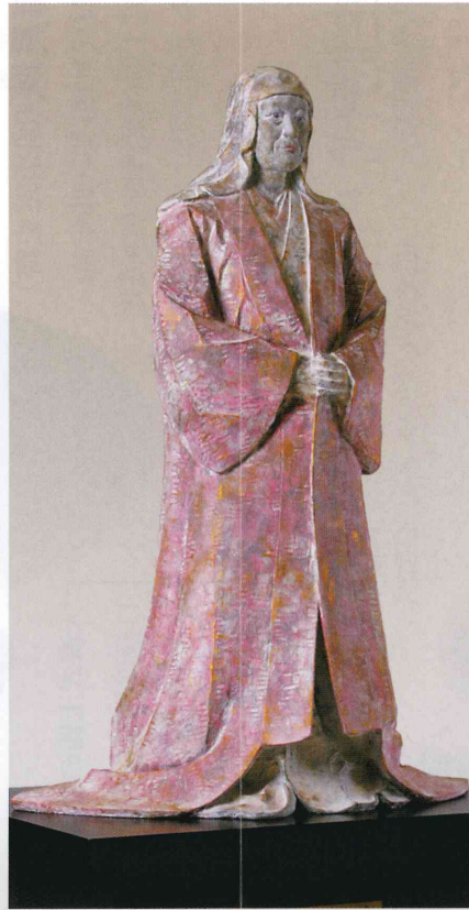
おだい かた 於大の方 (1528-1602)

母は水野氏の娘於大の方、岡崎城主松平広忠の嫡男として生まれる。幼名竹千代。今川義元の人質として駿府で成長する。於大の母源応尼に養育され、今川の軍師太源雪斎を師とした。関ヶ原の戦いに勝利し、1603年征夷大将軍に任ぜられて江戸幕府を開く。