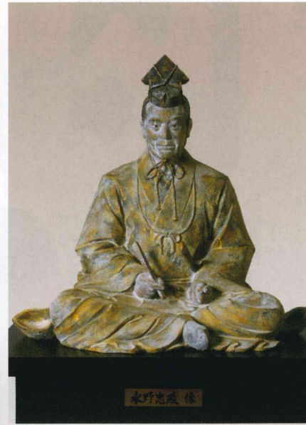
みずの ただまさ 水野忠政 (1493-1543)

緒川城に生まれる。父は緒川城主水野忠政、母は於富の方。14歳で岡崎城主松平広忠に嫁ぐ。翌年家康を産んだが、水野氏が織田方についたため、3歳の家康を残して岡崎を離縁された。後、阿久比の坂部城主久松俊勝に嫁ぎ、夫とともに家康の天下統一を支えた。