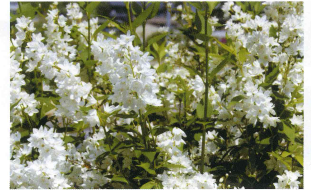
うのはな (ユキノシタ科ヒメウツギ) 5月～6月に花が咲きます

しらなみ みぎわ 白浪のかゝる汀とみえつるは をがはの里にさけるうの花 後徳大寺左大臣実定